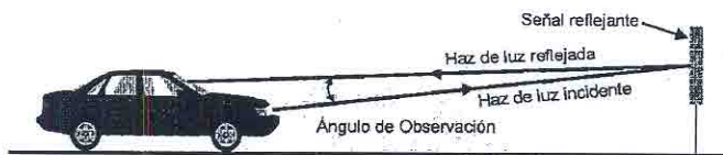
Figura 1 Ángulo de Observación